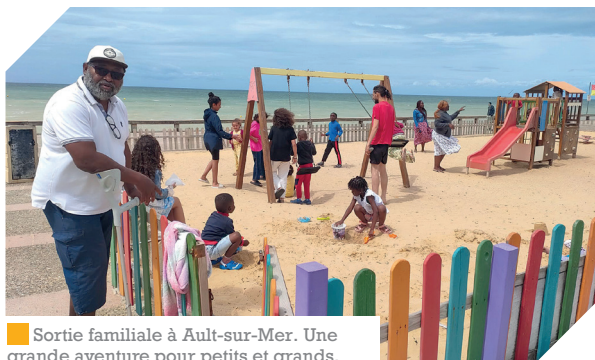
Sortie familiale à Ault-sur-Mer. Une grande aventure pour petits et grands.