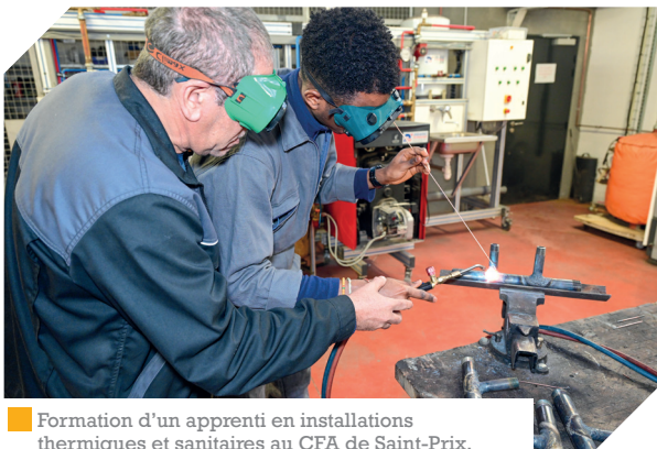
■ Formation d'un apprenti en installations thermiques et sanitaires au CFA de Saint-Prix.

renouvellement qui sera effectué en janvier 2024, après un audit de contrôle réalisé en janvier 2023 et conclu sur une note de conformité de 100 %. Ce label de qualité spécifique au secteur de la formation professionnelle s'applique à tous les organismes de formation souhaitant bénéficier de financements publics. Il repose sur un référentiel de 7 critères et de 32 indicateurs, que les organismes de formation doivent strictement respecter à travers des audits de contrôle réguliers. ■