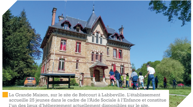
■ La Grande Maison, sur le site de Brécourt à Labbeville. L'établissement accueille 25 jeunes dans le cadre de l'Aide Sociale à l'Enfance et constitue l'un des lieux d'hébergement actuellement disponibles sur le site.